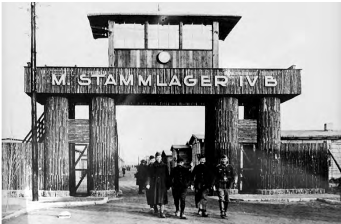
Вход в концентрационный лагерь