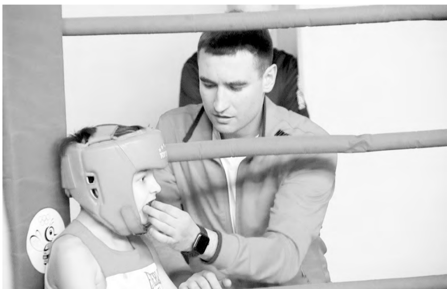
Глеб Юрьевич тренирует юных боксеров

Кто, если не я? По такому принципу живут мои родители. В 1999 году они уехали из Самары, перебрались из крупного города в небольшое село... По такому принципу складывается и моя жизнь.